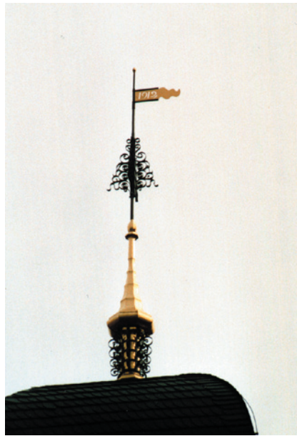
Kirchturmbekrönung in Falkenberg Jugendstilturmbekrönung symboli- siert den Reis Isai, Schmiedeteile in Edelstahl, Kupfer wurde restauriert.