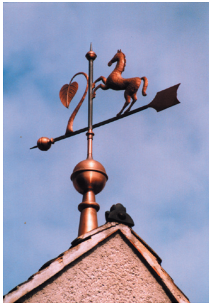
Firstschmuck in Altenbach Handgetriebenes Pferd aus Kupfer, komplette Lackierung mit witterungsbeständigem Klarlack