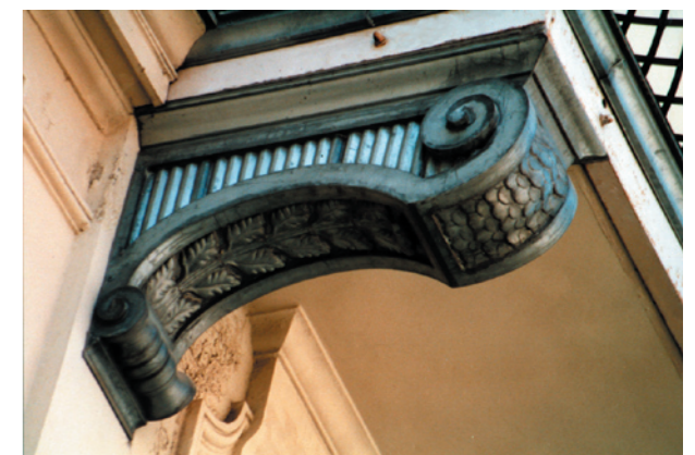
Balkonunterzug in Leipzig Neuanfertigung nach Original, Hebebühnenmontage