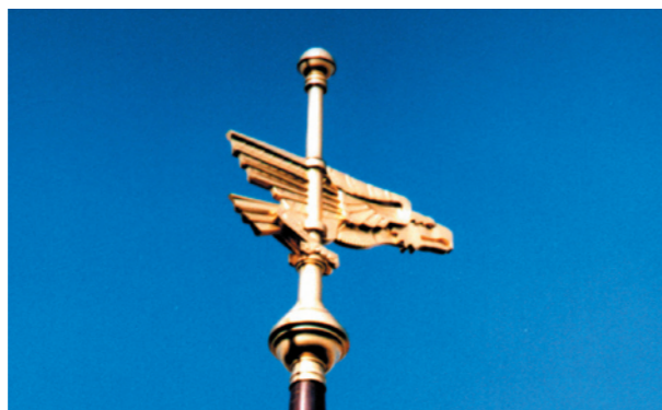
Dachreiter in Leipzig Neuanfertigung des Adlers aus Kupferblech nach historischem Vorbild, Fertigungszeit: 3 Wochen