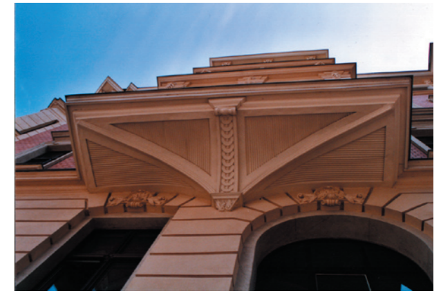
Erkerkonsole in Leipzig Restaurierung und Stabilisierung des Unterzuges

Wir hoffen, dass wir Ihnen einen kleinen Einblick in unser Leistungsspektrum vermitteln konnten und darüber Ihr Interesse geweckt haben. Nun müssen Sie uns nur noch Ihre Probleme oder Wünsche nennen - wir sind sicher, dafür die passende Lösung zu haben.