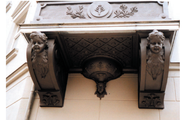
Balkonverkleidung in Mittweida Restaurierung und Neuanfertigung aus Zink