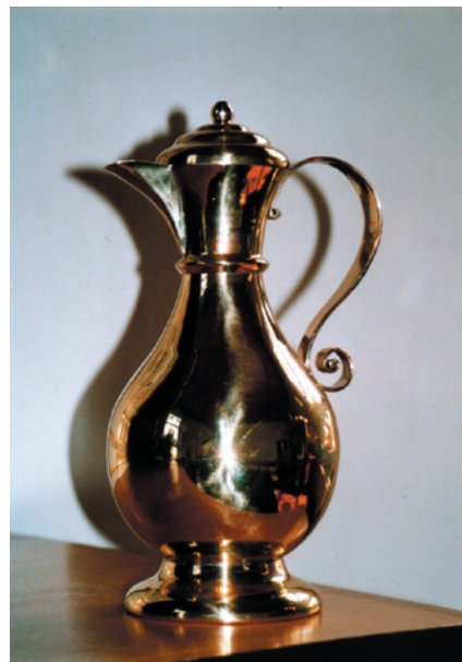
Taufkanne in Lübbenau Entwurf und Neuanfertigung der Taufkanne als Ergänzung zum barocken Taufengel