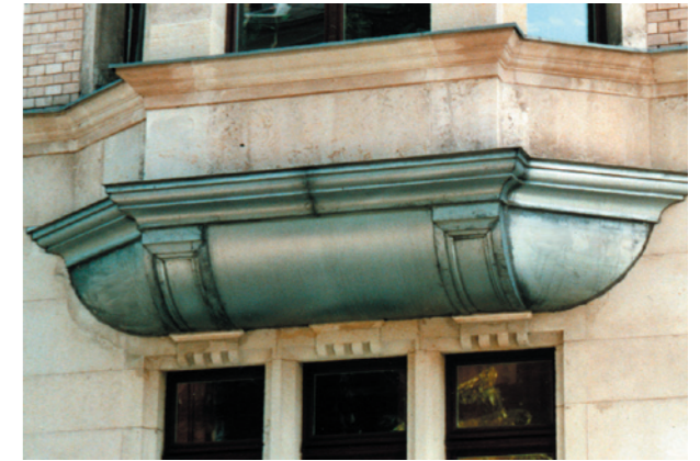
Erkerkonsole in Leipzig Neuanfertigung nach historischem Original