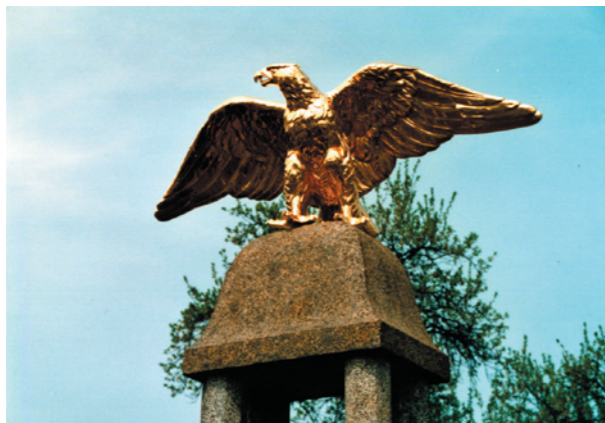
Kriegerdenkmal in Großkittlitz Restaurierung des stark korrodierten Zink-Adlers, Nachmodellierung der Füße und Vergoldung