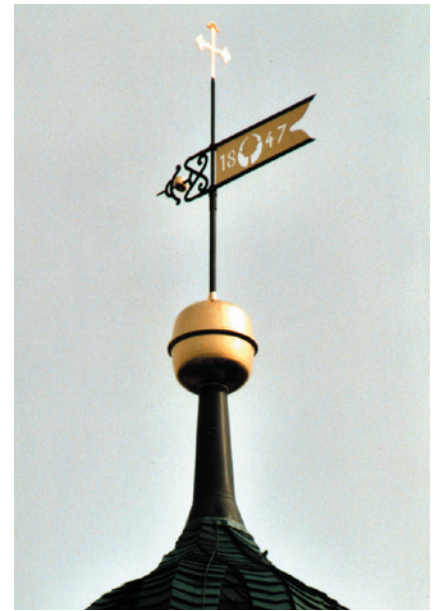
Kirchturmbekrönung in Gräfendorf Wetterfahne wurde nach Bilddoku- menten hergestellt, Kugel nach his- torischen Fragmenten gefertigt