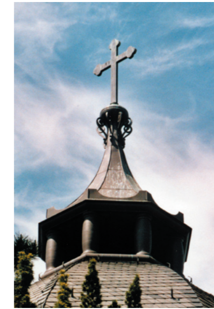
Friedhofskirche in Delitzsch Der Turmknopf mit Kreuz wurde nach historischem Vorbild aus Kupfer gestaltet