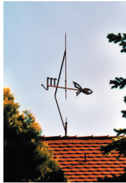
Wetterfahne in Wurzen Abstrahierte Wetterfahne mit Fisch als christliches Symbol und Sternzeichen

Der beste Freund des Menschen ist oft ein Tier - warum den Liebling also nicht auf dem Dach verewigen lassen? Ob naturgetreu oder stilisiert, ob zweidimensional oder plastisch: bei uns findet jeder das Richtige auch für die Gestaltung von Garten oder Balkon. Der Einsatz verschiedenen Materialien oder die individuelle Gestaltung von Oberflächen gewährleisten schließlich, dass das Einzelstück in jedem Fall ein Unikat bleibt.