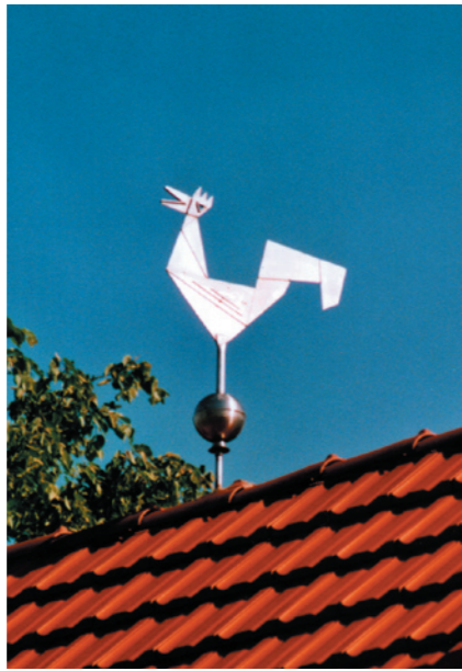
Wetterhahn in Wurzen Abstrakter Wetterhahn mit Kugel aus Edelstahl rostfrei, gefertigt und montiert