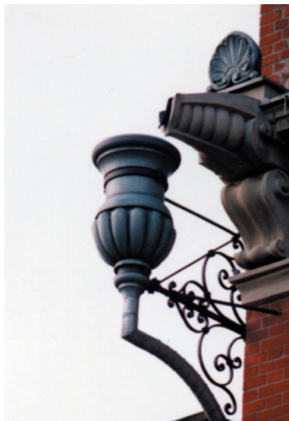
Wasserkasten in Dahlen Entwurf und Neuanfertigung nach Fotos Höhe: 80 cm