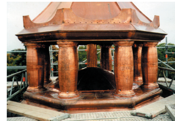
Friedhofskirche in Delitzsch Die 80 cm hohen Säulen mit Basis und Kapitell wurden als Holzverkleidung vor Ort zusammenschweißt

Kein Ornament am Bau, was bei uns nicht in versierten Händen wäre: wir prägen in allen Formen und Größenaus Metall - sei es ein Bogen, eine Muschel, eine Blume oder ein anderes Schmuckstück. Und was sich nicht prägen oder maschinell umformen läßt, wird als Einzelanfertigung auch handgetrieben. Um die gefertigten Teile nach der Umformung weiter verarbeiten oder montieren zu können, verfügen wir über ein großes Repertoire an Fügeverfahren bereit.