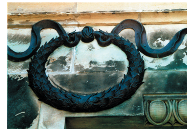
Friedhofskirche in Delitzsch Der handgetriebene Grundkörper ist mit drei verschiedenen Blattgrößen verziert