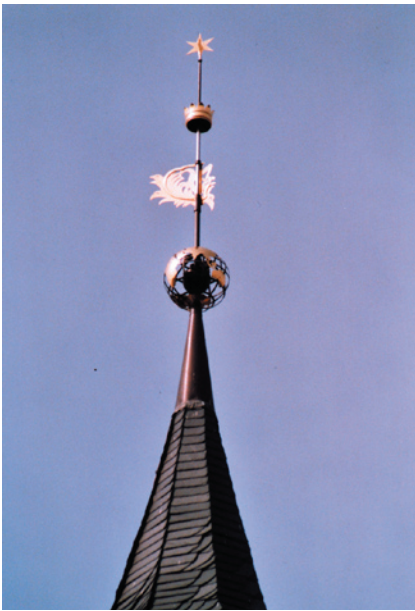
Kirchturmbekrönung in Ahlsdorf Weltkugel, Wetterfahne hat als Symbol einen Palmwedel. (bibl. Symbol)